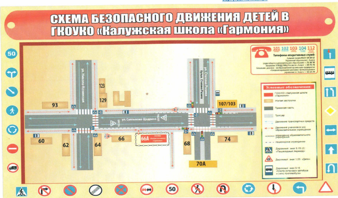
Пути движения транспортных средств к местам разгрузки/погрузки и рекомендуемые пути передвижения детей по территории ГКОУКО «Калужская школа «Гармония»