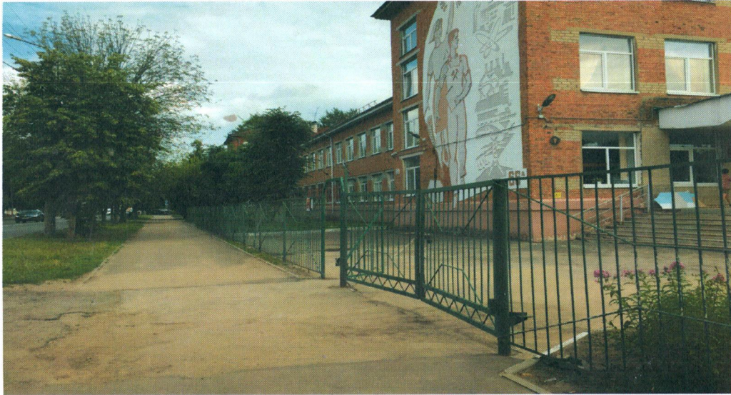
Фото на странице: 1